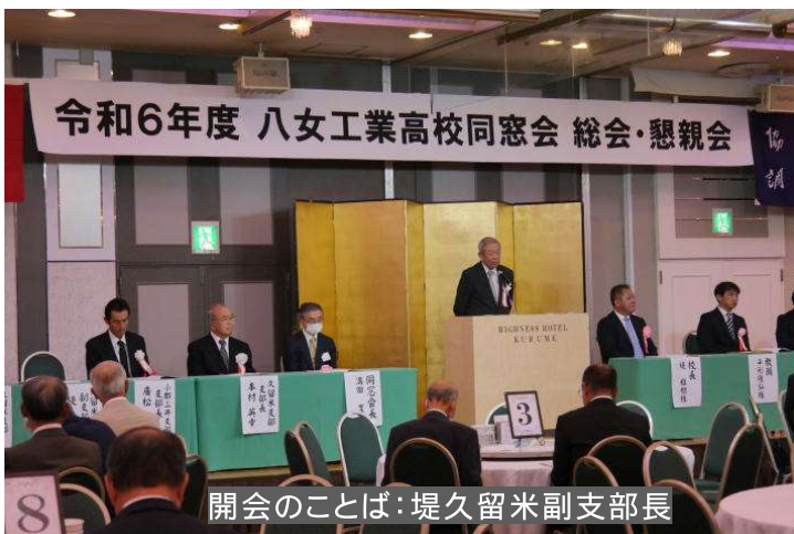
開会のことば：堤久留米副支部長