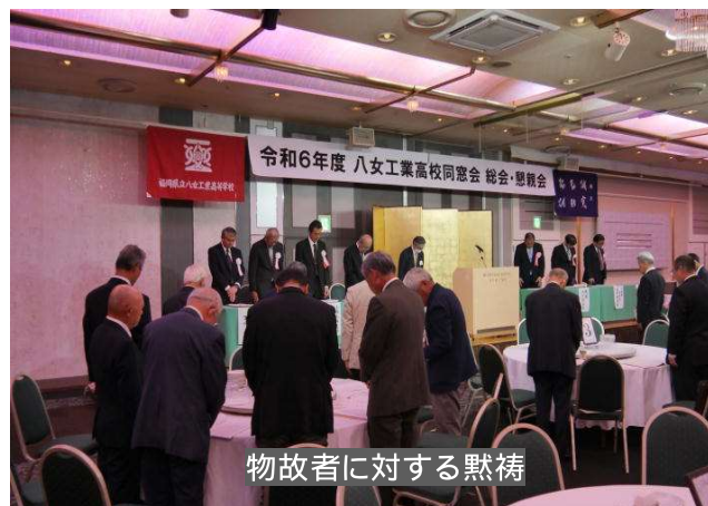
物故者に対する黙祷