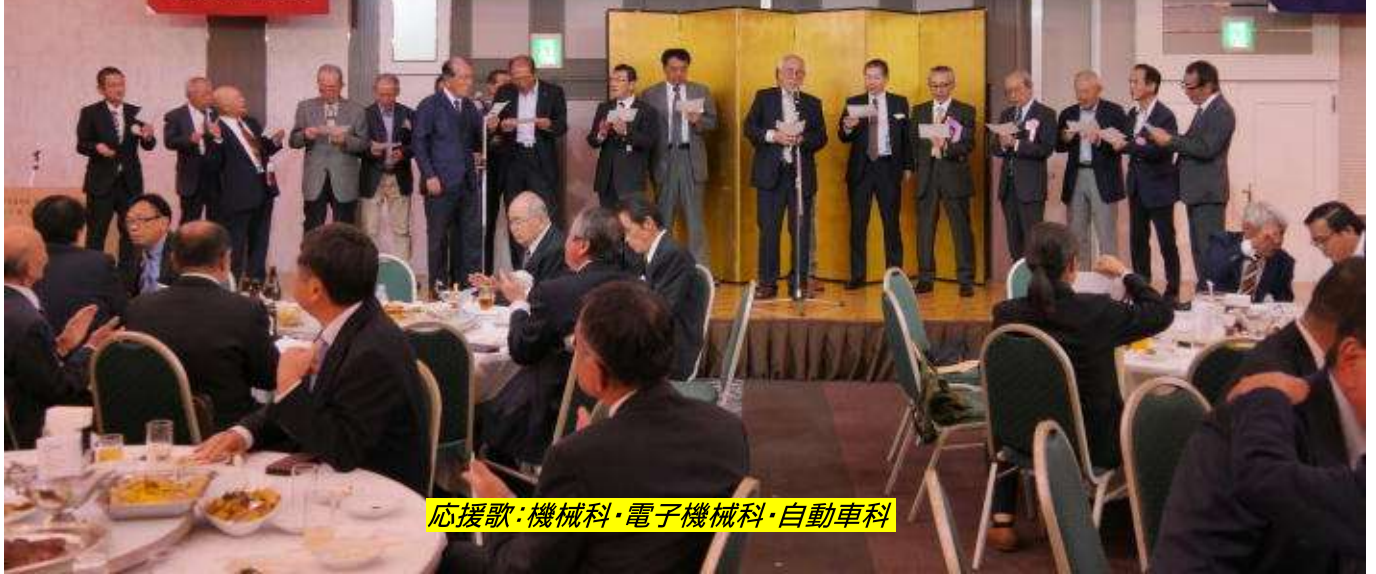
応援歌: 機械科・電子機械科・自動車科