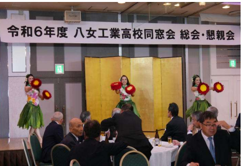
令和6年度 八女工業高校同窓会 総会・懇親会