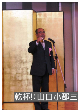
乾杯！：山口小郡三井支部事務局長