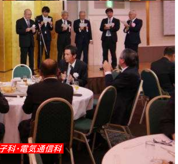
応援歌: 電気科・情報技術科・電子科・電気通信科