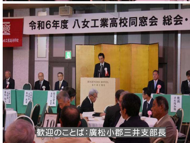
歓迎のことば：廣松小郡三井支部長