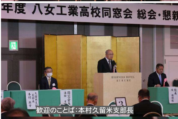
歓迎のことば：本村久留米支部長