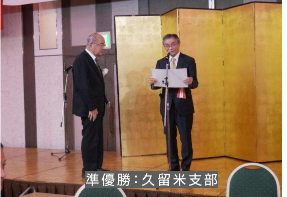
準優勝:久留米支部