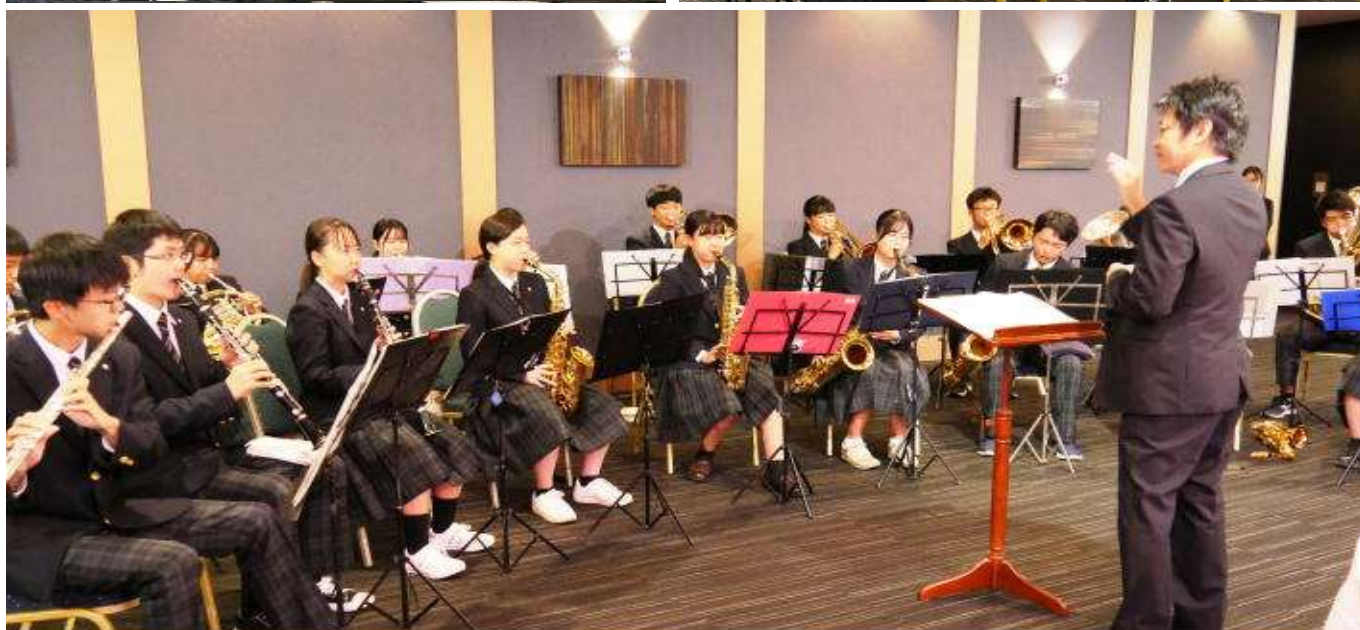
母校吹奏楽部の演奏