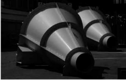
流量調整装置（ボルテックスバルブ）