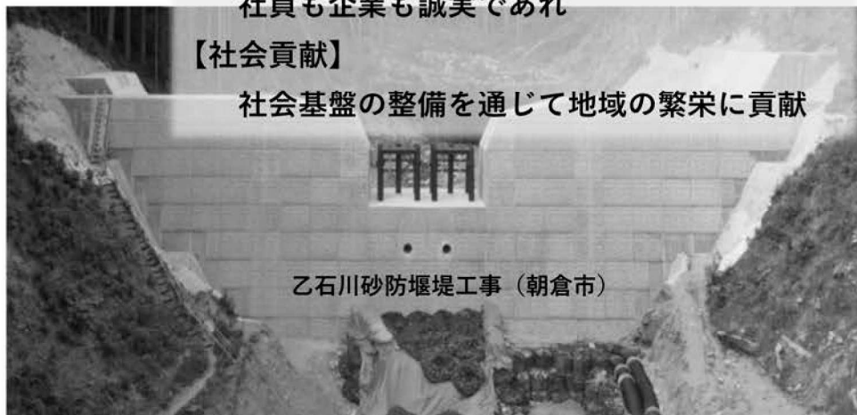
乙石川砂防堰堤工事（朝倉市）