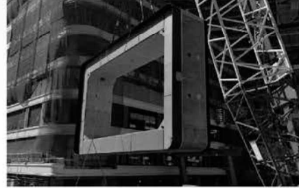
推進工法用ボックスカルバート