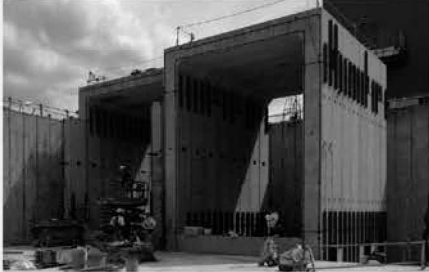
軌道消雪用貯水槽兼雨水調整池