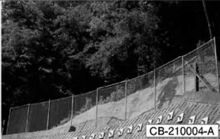
小規模落石防護柵（ライトバリア）