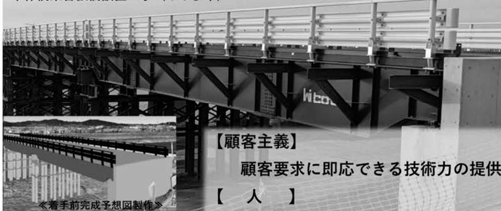
幸作橋架替仮橋設置工事（みやま市）