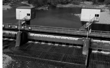
耐摩耗高強度コンクリートパネル（老朽化対策）