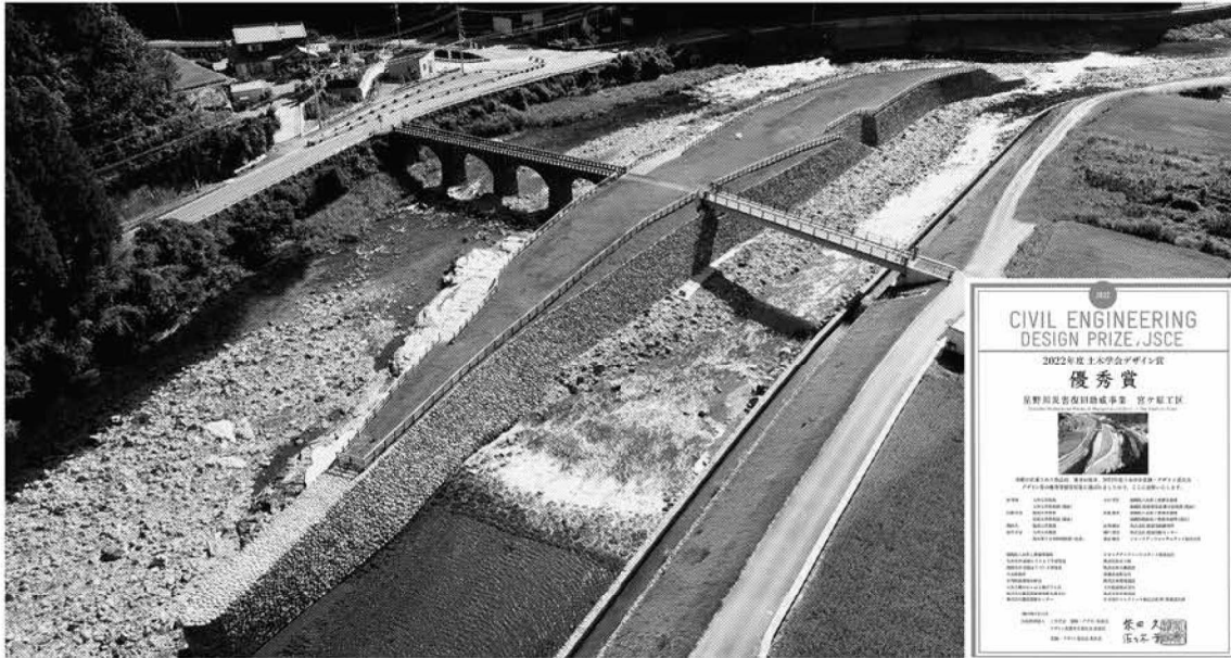
2022年土木学会デザイン賞 優秀賞 星野川災害復旧助成事業 宮ヶ原工区 (発注者：福岡県八女県土整備事務所、八女市) (弊社担当：河道部詳細設計、公園橋詳細設計、宮ヶ原橋(石橋)高欄景観検討、担当技術者：岩橋直生(土木H5卒))